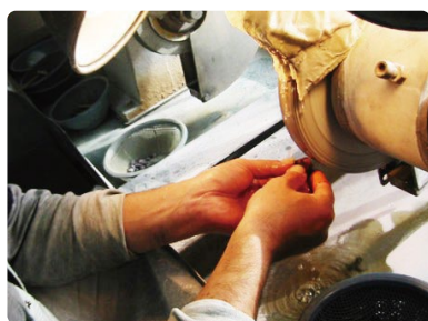
職人が玉を手作業で削り出します