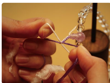
京都の熟練数珠職人がひとつひとつ心を込めて組み上げます