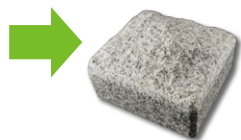
切り出した ブロックを送付